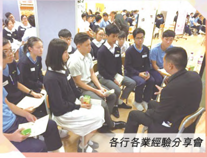
各行各業經驗分享會