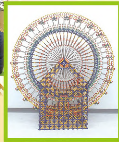
在老師的指導下，學生完成組合的電動摩天輪。