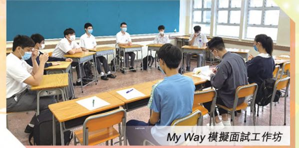
My Way 模擬面試工作坊

透過校本生涯規劃課程，並配合東華三院何玉清教育心理服務中心推行「My Way」中學生生涯發展教育計劃，運用外間機構的豐富資源，有系統地推行多元化的輔導活動，引導學生在中一至中六不同階級作探索，從個人特質開始，到升學途徑與職業世界的探索，幫助學生得到全人發展，引導學生作出合適、專屬自己的生涯規劃，讓學生終身受用。