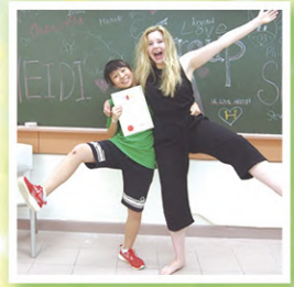
參與東華三院聯校劍橋牛津英語營

除本校老師外，駐校社工及定期到訪的教育心理學家及言語治療師提供專業支援；另聘有專業導師教授學生如戲劇、舞蹈、音樂、田徑、球類及各種課後支援課程等。