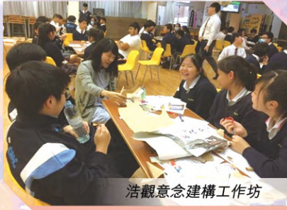
浩觀意念建構工作坊