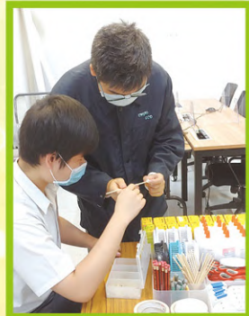
學生在課餘時候學習組裝多足機械人。