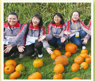
東華三院學生大使溫哥華參訪團