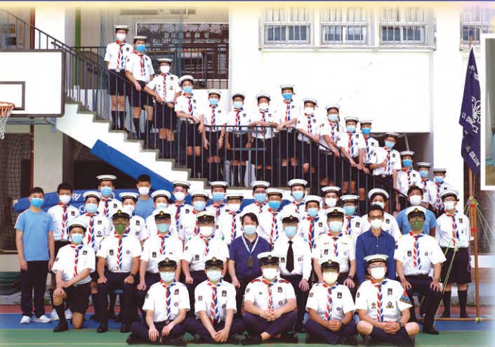
本校海童軍人才濟濟，提供一系列訓練紀律、團隊精神、領袖才能的活動予同學。