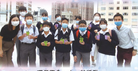
環保學會一人一花活動