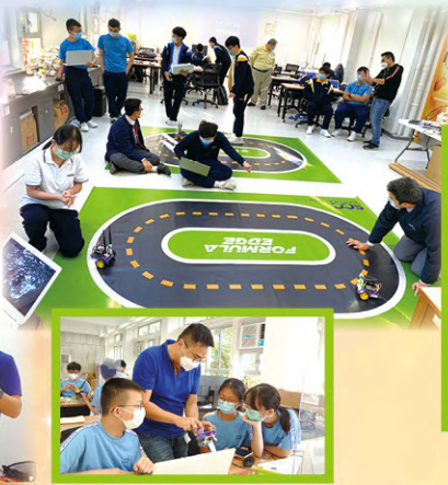
學生準備參加 Inter-School AI Formula Edge Competition 賽事