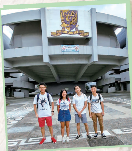
中六級同學出席中文大學地理及資源管理學系之「氣候變化對全球水資源和能源的影響」講座。