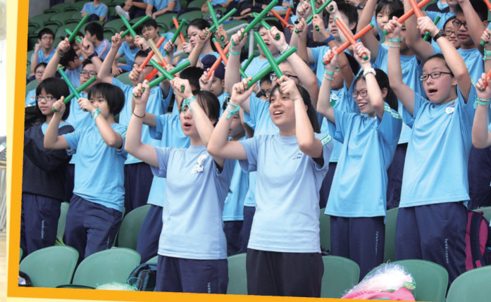
舉辦四社陸運會「啦啦隊比賽」，培養學生團隊合作精神。