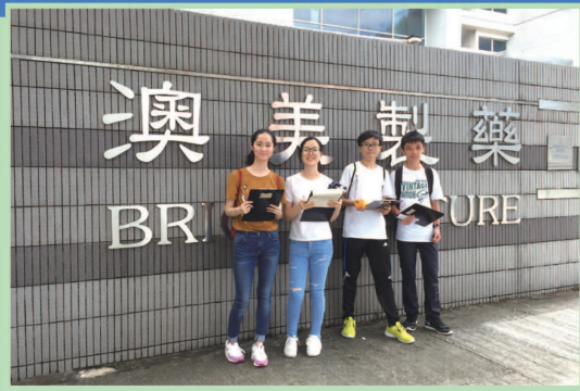
中四及中五同學參加可觀自然教育中心暨天文館舉辦之「工業位置選點」課程。