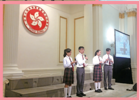
學生出席禮賓府 晚宴時分享是次 參訪團的體會。