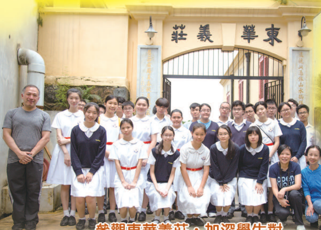
參觀東華義莊，加深學生對東華三院慈善服務的認識。