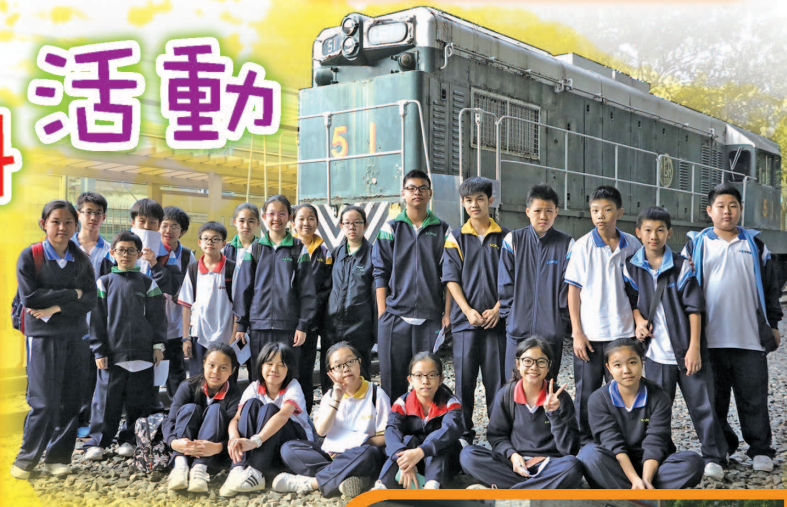
22名同學參觀鐵路博物館及碗窑。