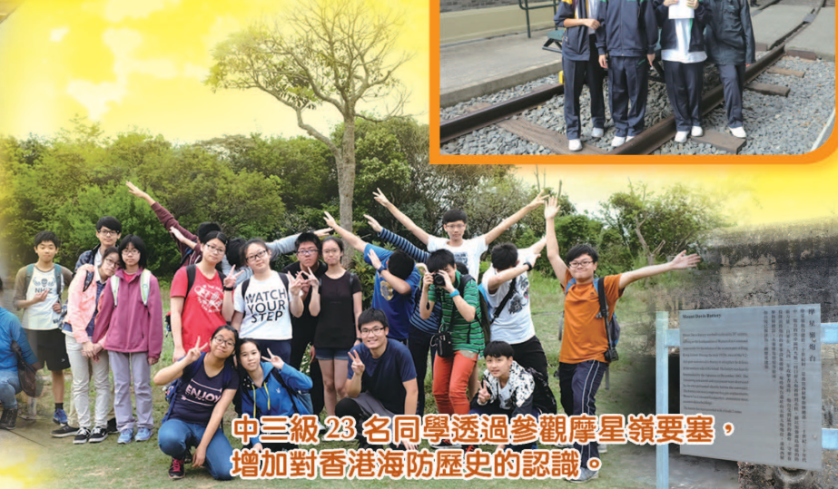
中三級23名同學透過參觀摩星嶺要塞，增加對香港海防歷史的認識。