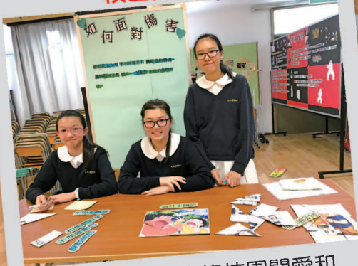
協助推廣及宣傳校園關愛和生命教育活動