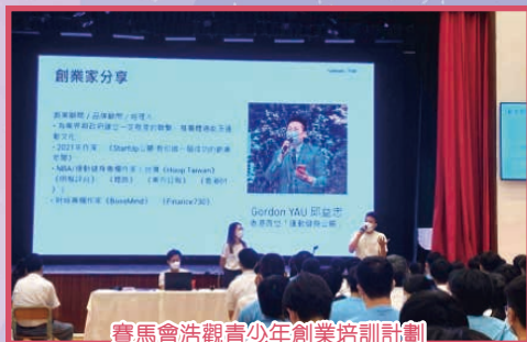
賽馬會浩觀青少年創業培訓計劃

透過校本生涯規劃課程，並配合東華三院何玉清教育心理服務中心推行「My Way」中學生生涯發展教育計劃，運用外間機構的豐富資源，有系統地推行多元化的輔導活動，引導學生在中一至中六不同階級作探索，從認識個人特質，到探索升學途徑與職業世界，讓學生「知己」、「知彼」，引導學生規劃人生。