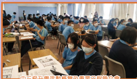
中三級升學活動概覽及重要日程簡介會