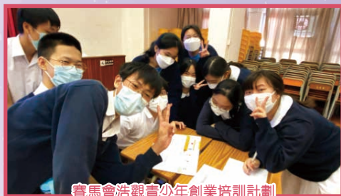
賽馬會浩觀青少年創業培訓計劃