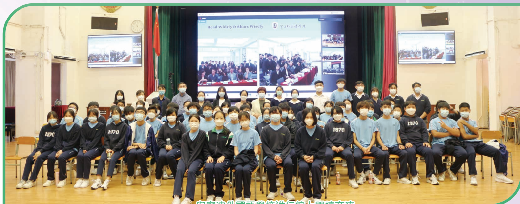
與寧波外國語學校進行線上閱讀交流