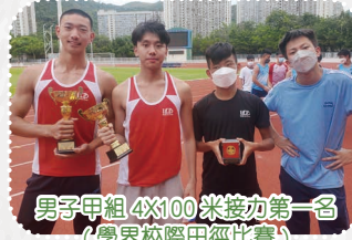
男子甲組 4x100 米接力第一名 (學界校際田徑比賽)