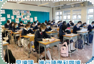
早讀課- 進行跨學科閱讀