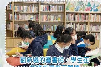
翻新過的圖書館，學生在 舒適的環境下閱讀