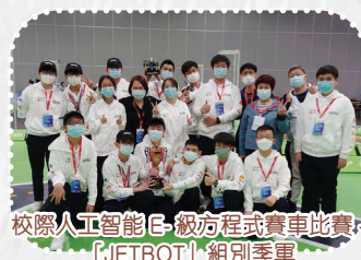
校際人工智能 E-級方程式賽車比賽-「JETBOT」組別季軍