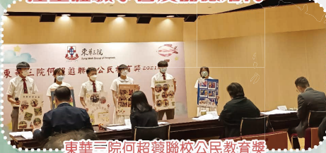
東華三院何超瓊聯校公民教育獎