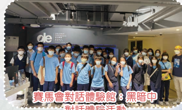
賽馬會對話體驗館：黑暗中 對話體驗活動