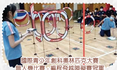
國際青少年科創奧林匹克大賽 無人機比賽-編程飛越障礙賽冠軍