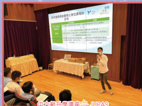
中六級升學講座 — JURAS