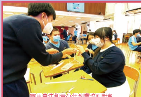
賽馬會浩觀青少年創業培訓計劃