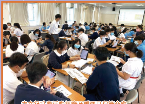
中六級升學活動概覽及重要日程簡介會