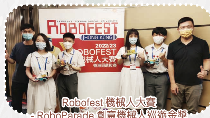
Robofest 機械人大賽 RoboParade 創意機械人巡遊金獎