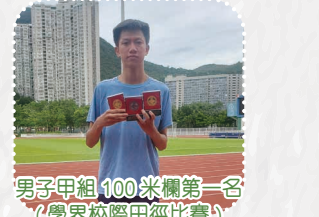
男子甲組 100 米欄第一名 (學界校際田徑比賽)