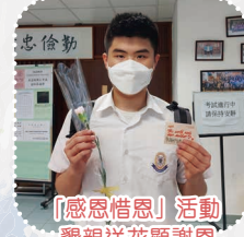
「感恩惜恩」活動 - 懇親送花顯謝恩