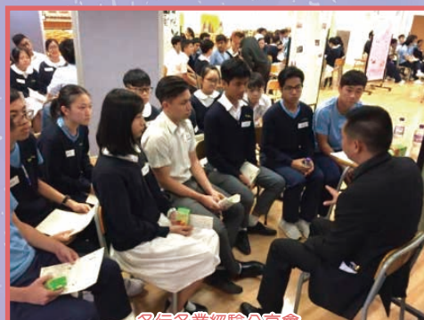
各行各業經驗分享會