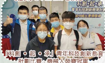
「科創·起·承」青年科技創新教育計劃比賽-機械人競賽冠軍