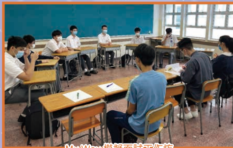
My Way 模擬面試工作坊