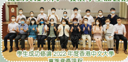
學生成功修讀 2022 年度香港中文大學 夏季資優課程