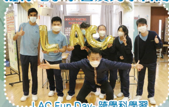
LAC Fun-Day- 跨學科學習